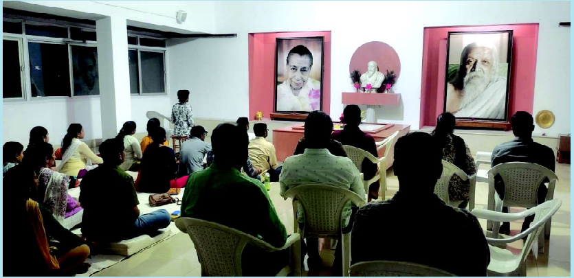
Sunday Swadhyaya at Meditation Hall