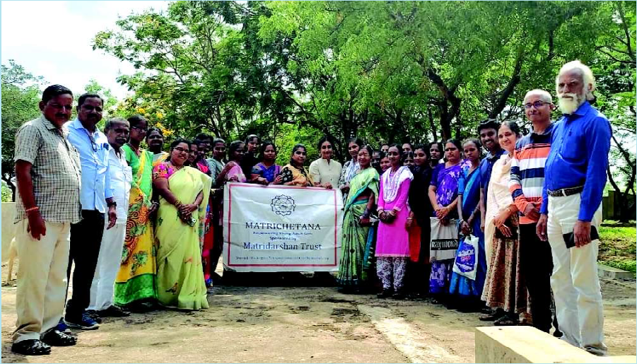
MatriChetana - to empower the rural women.