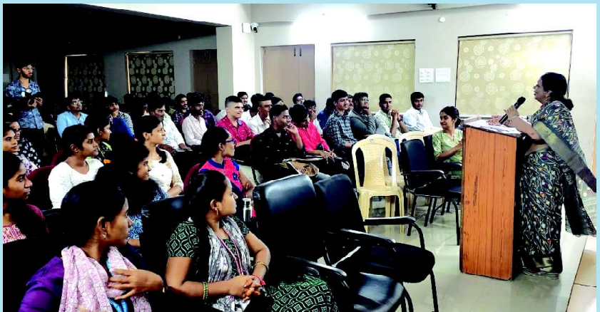
Youth Conference held on 26th July 2024 @ Seminar Hall MBA Block, Keshav Memorial Institute of Commerce & Science (KMICS), Hyderabad.